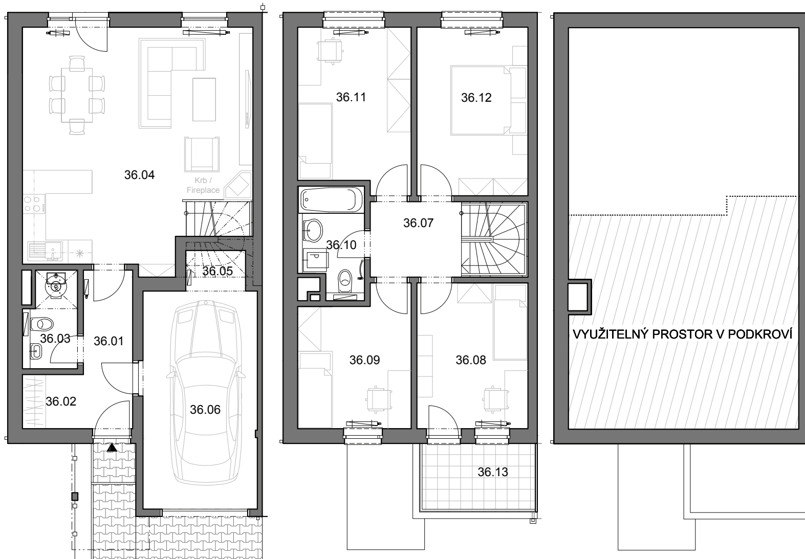
PŮDORYS 1.NP / LAYOUT 1st AGF